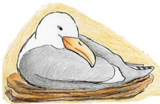
Düne hinter der eine Möwe mit Nest versteckt ist