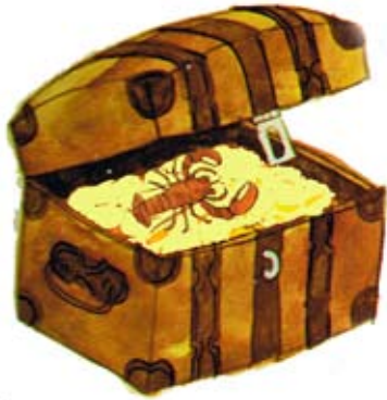
Schatztruhe mit Hummer

Die „Klapp-Mal-Bilder“ sind aus Holz mit einer Klappe hinter der sich etwas versteckt